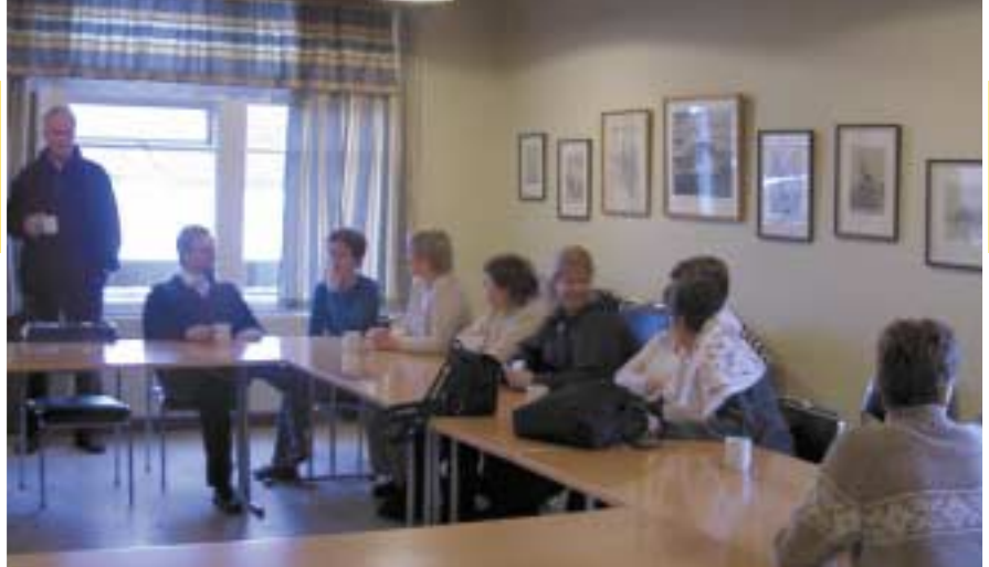
...frá fræðsluferð starfsfólks til Vestmannsvatns.