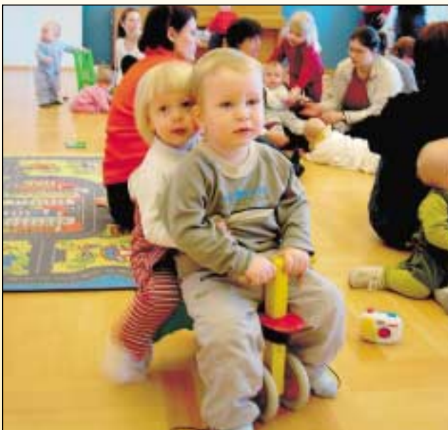
... frá opnu húsi fyrir foreldra og börn.

Rösklega 140 börn eru nú í fermingarfræðslu í Glerárkirkju. Hver bekkjardeild kemur einu sinni í viku í kirkjuna og þar fer fræðslan fram. Studst er við bókina „ Lif með Jesú “. Helstu höfuðþáttum trúar- og mannlífs og síðan er stutt helgistund í kirkjunni. Lagt hefur verið að börnum og foreldrum þeirra að sækja guðsþjónustur í kirkjunni og er einkar ánægjulegt að sjá hversu vel sóttar samverur kirkjunnar eru. Foreldrar fjölmenna til kirkju ásamt börnum sínum og er það mikið gleðiefni.