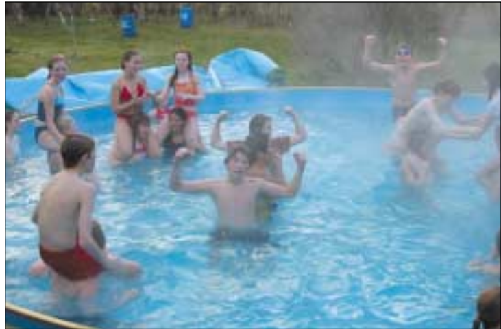
...úr ferð fermingarbarna til Löngumýrar.