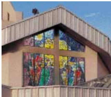
Glugginn góði - gjöf kventfélagsins

Áður er nefnt að sóknarbörnum hefur fjölgað mjög undanfarin ár. Sóknin hefur um langa tíð verið meðal þeirra stærstu á landinu þegar lagt er til grundvallar fjöldi sóknarbarna á hvern prest. Skylda kirkjunnar við sóknarbörn um hvers kyns þjónustu hefur því eðlilega aukist og höfum við fullan metnað til að mæta þeim þörfum og skyldum. Í þessu sambandi má