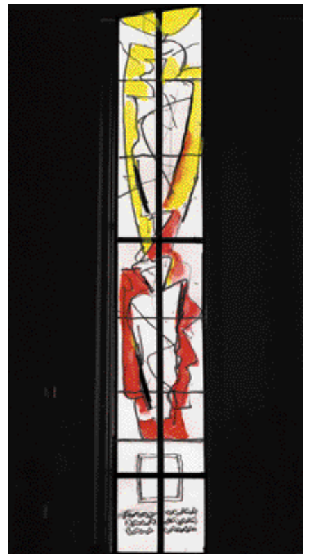
Drög að tillögum um glugga.