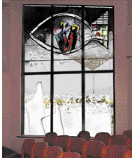
Drög að tillögum um suðurglugga.

Eins og kirkjugestir hafa séð á myndum í anddyri kirkjunnar er ráðgert að steint gler verði sett í glugga kirkjuskips-