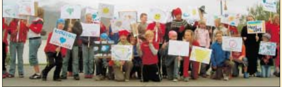
Krakkarnir á TTTmóti ÆSKEY í Hrísey um síðustu helgi skelltu sér í meðmælagöngu í þágu kærleika!