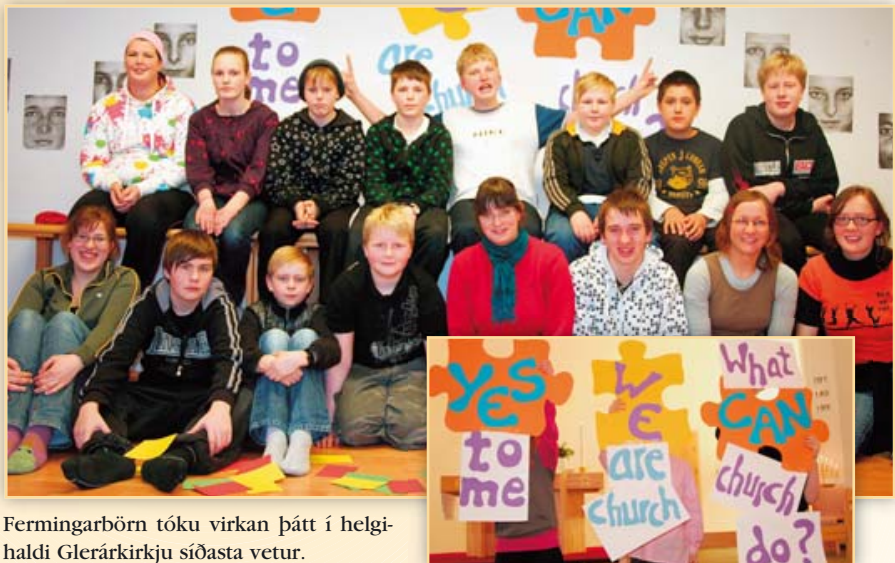
Fermingarbörn tóku virkan þátt í helgihaldi Glerárkirkju síðasta vetur.

Fermingarfræðslan hefst í þriðju viku septembermánaðar og fá fermingarbörn fljótlega bréf þess efnis frá prestum kirkjunnar.