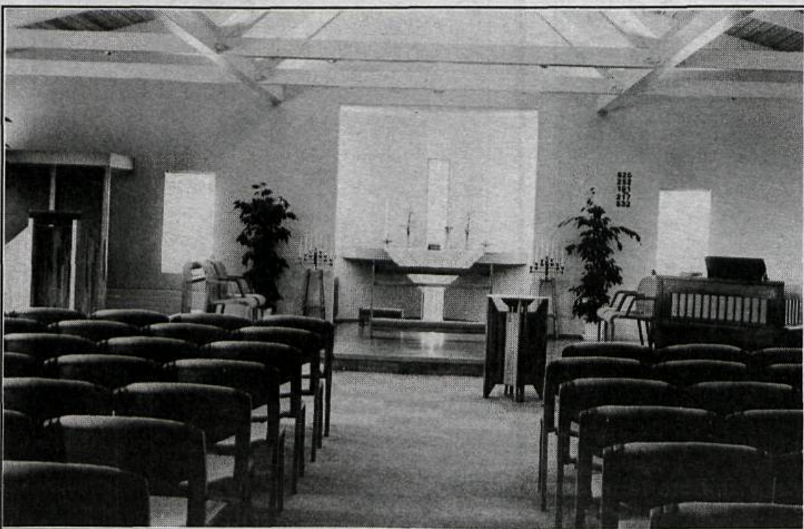
Bráðabirgðakirkjan í suðurálmunni. Þetta húsnæði hefur þjónað Glerársöfnuði sem kirkja um hríð og á sinn þátt í að byggja upp ímynd eigin kirkju í augum íbúa Glerárhverfis.