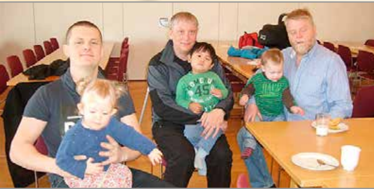
Við erum stolt af því að pöbbumum fjölgar sem mæta á foreldramorgna!