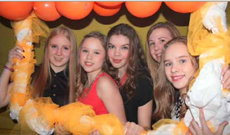
Glaðar stelpur á landsmóti.

Á Landsmóti KFUM og K í Vatnaskógi. Núllin eru til marks um átakið „Stop poverty“ sem snýr að því að segja fátækt stríð á bendur með því að gera yfirlýsingu um að það sé ekkert ásættanlegt annað en að það sé „Núll fátækt í beiminum“.