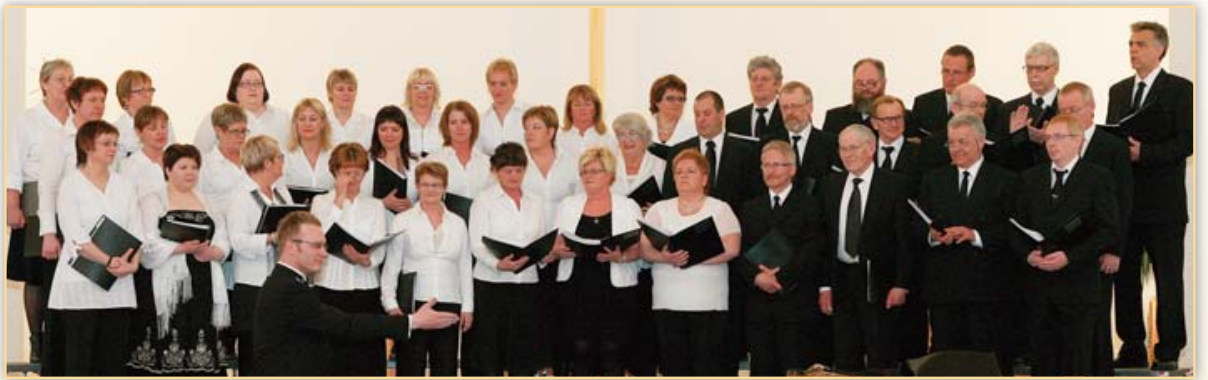
Frá vortónleikum Kórs Glerárkirkju 18. apríl 2010.