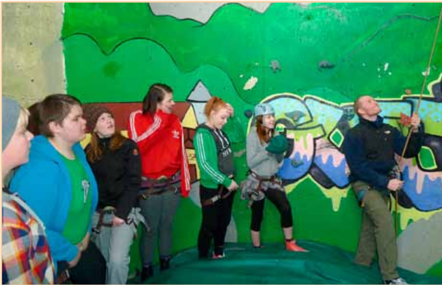
Unglingastarfið í Glerárkirkju er fjölbreytt. Á vordögum fór hópur úr starfinu til Reykjavíkur. Í ferðinni fékkst hópurinn meðal annars við þá áskorun að sigrast á klifurvegnum í Gufunesbæ í Reykjavík.