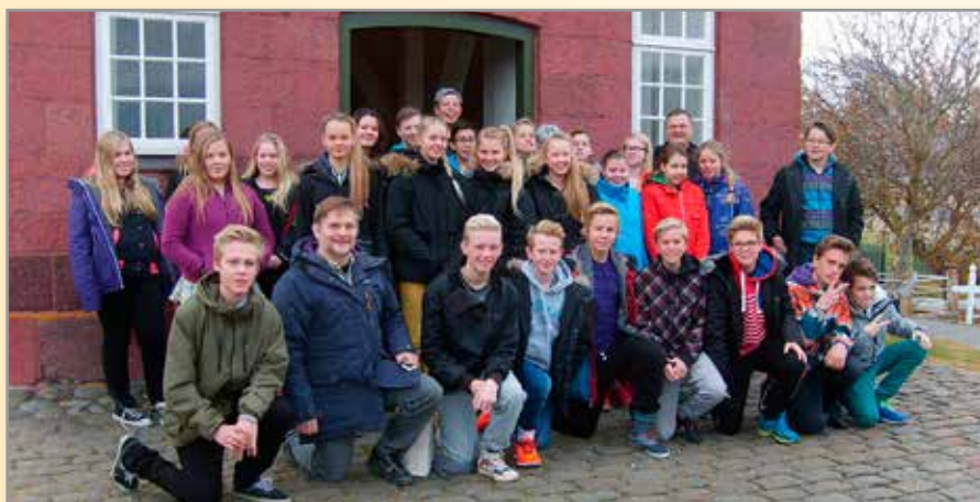
Fermingarbörn fyrir utan Hóladómkirkju í október 2013.