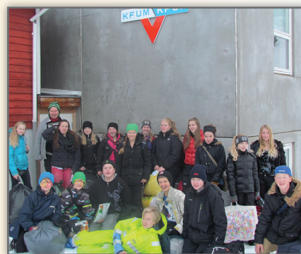
Unglingastarfið UD-GLERÁ befur gengið vel í haust en að þessu sinni er Glerárkirkja í nánu samstarfi við KFUM og KFUK á Akureyri. Myndin er tekin á Hólavatni að lokinni gísti-ferð þangað laugardaginn 24. nóvember.