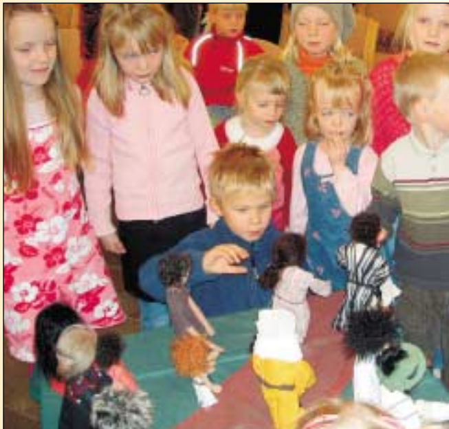
Börn í barnaguðsþjónustu virða fyrir sér bíbliubróður.