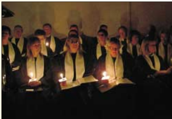
„Þannig lýsi ljós yðar meðal manna...“ (Matt. 5:16)