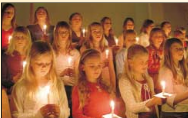
„Þér eruð ljós heimsins...“ (Matt. 5:14)

Í nóvemberbyrjun var hin árvissa söfnun fermingarbarna fyrir Hjálparstarf kirkjunnar. Fermingarbörnin í Glerárkirkju lögðu sitt af mörkum og gengu í hús í Glerárhverfi. Söfnunin gekk í alla staði vel og tekið var vel á móti börnunum. Þessi söfnun er til að efla ýmis verkefni í Afríku en þar er skortur á góðu neysluvatni víða mikið vandamál. Er skemmst frá því að segja að alls söfnuðust 250 þúsund krónur og er það hreint frábær árangur að okkar mati. Hafi börnin og allir er lögðu söfnuninni lið þakkir fyrir framlagið.